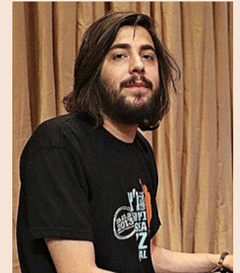
Los Veranos de la Villa arrancarán con el concierto de Salvador Sobral.